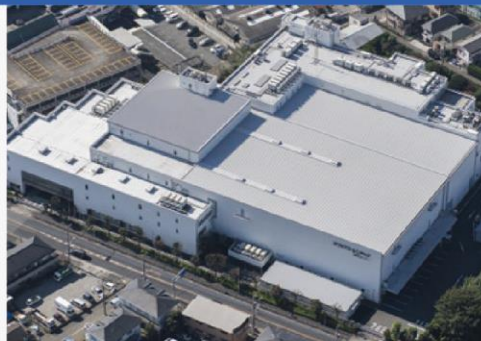
東京技術センター(東京都町田市)