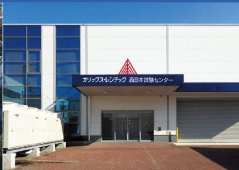
西日本試験センター(兵庫県尼崎市)